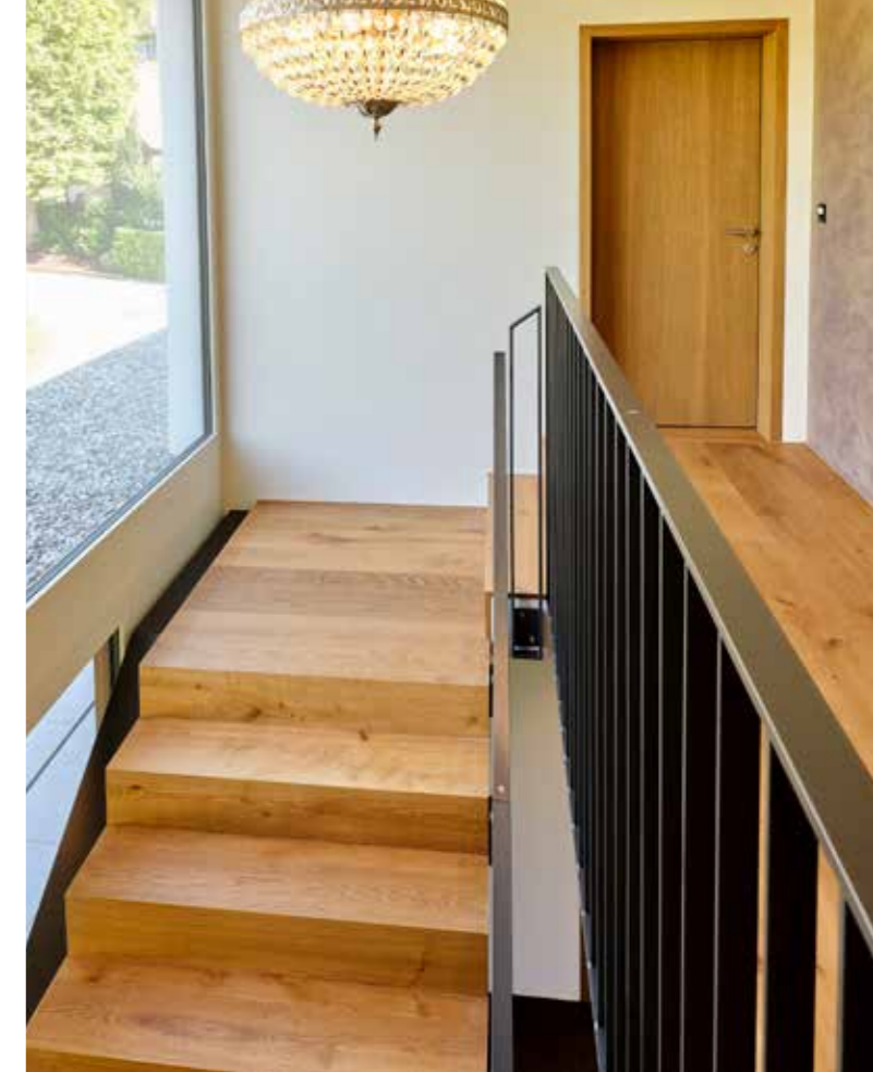
Heller, eleganter und schlichter Eingangsbereich eines Mehrfamilienhauses. Die Materialisierung ist langlebig und pflegeleicht.

Wundervolle Formgebung mit natürlichen Materialien – entdeckt an der Möbelmesse Mailand.