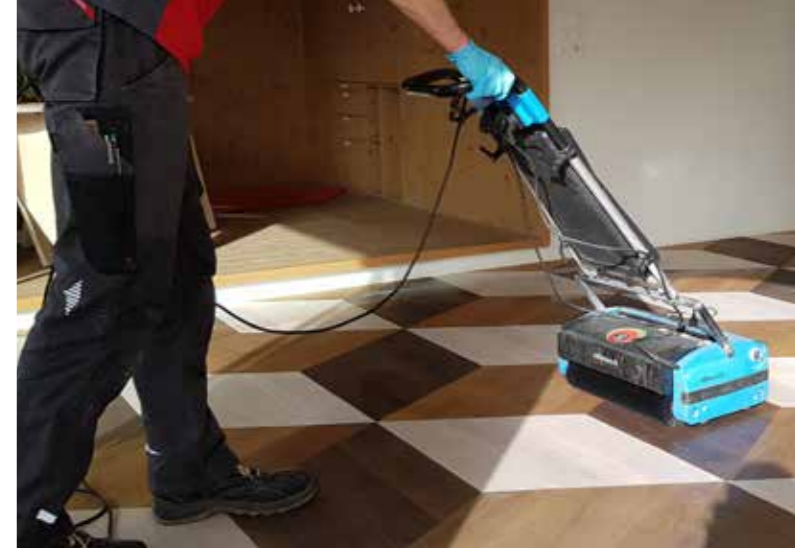
Oberflächen können aufgefrischt oder erneuert werden, um eine neue Haptik und einen neuen Look zu erhalten.