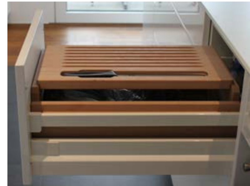
Die klassische Brotschublade mit Schneidebrett als Nachrüstsatz für jede Küche.

Die Griffe an den neuen Küchenfronten werden durch selbstöffnende Druckknöpfe ersetzt. Alte abgegriffene Möbelgriffe sind einfach wegzuschrauben und lassen Platz für neue Gestaltungsmöglichkeiten. Die Modellauswahl bei Möbelgriffen ist beinahe unendlich. Bei offenen Regalen können weisse Rückwände und Tablare durch Holz- oder farbige Rückwände ersetzt werden. Zimmertüren mit schlechten Schliesseigenschaften lassen sich mit