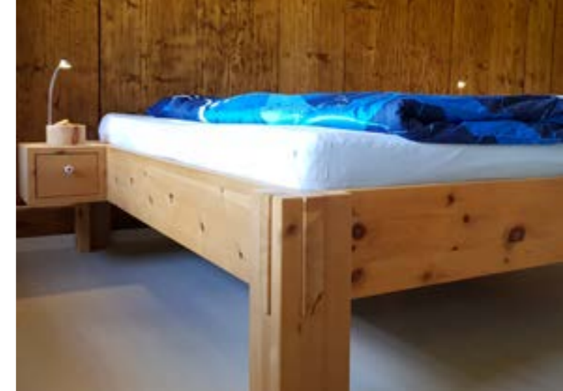
Arve kann den Puls vermindern und helfen, einen guten Schlaf zu finden.

Die antiseptische Wirkung von Holz wurde von unseren Vorfahren immer wieder genutzt, um Krankheiten zu bekämpfen. Metzger verwenden heute wieder zunehmend Holzschneidebretter aus Buche, Ahorn und Pappelholz, weil damit die besseren Resultate in hygienischer Hinsicht erreicht werden als mit andern Schneideunterlagen. Das Arvenzimmer und die Arvenkissen vermindern den Puls und tragen dazu bei, einen ausgewogenen Schlaf zu finden. Die Herzfrequenz kann sichtlich gesenkt werden und die ätherischen Öle haben eine befreiende Wirkung auf unseren Atem. Der klassische Waldspaziergang entwickelt sich immer mehr zu einer Gesundheitswanderung, denn durch die Phytonzide werden Wirkstoffe freigesetzt, welche das Immunsystem des Menschen beeinflussen oder