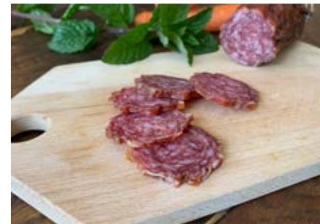
Schneidebretter aus einheimischen Laubhölzern sind beliebt wegen ihrer antiseptischen Wirkung.

Die Angst der Menschen, nachts in den Wald zu gehen, hat einen klaren Zusammenhang aus der Frühzeit, denn man glaubte an die Beseeltheit der Bäume. Immer wieder gab es Sagen über Begegnungen mit geisterhaften Gestalten, die in den Bäumen hausten. Darin begründen sich ebenfalls die Geschichten über Geisterhäuser und Dämonen, die in Balken weiterleben. Die Erzählungen finden sich in allen Kulturen, wo sich Hölzer, Bäume und Menschen begegnen. Im Holz liegen tatsächlich Kräfte verborgen, die uns Menschen echt beeinflussen können.